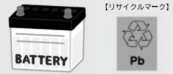
自動車用バッテリー