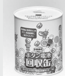
【ボタン電池回収缶】