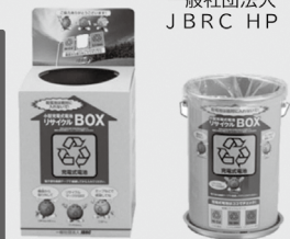
小型充電式電池 リサイクル回収ボックス