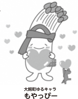
大町ゆるキャラ もやっぴー