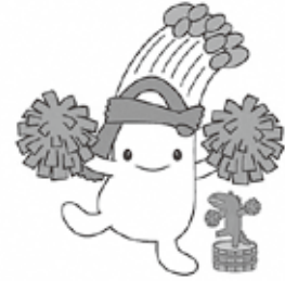
大鰐町ゆるキャラ もやっぴー