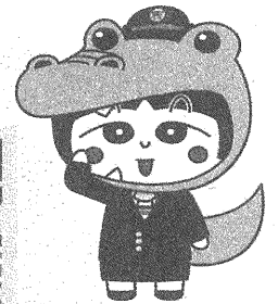
黒石警察署マスコット「おとめちゃん」大鱧Ver