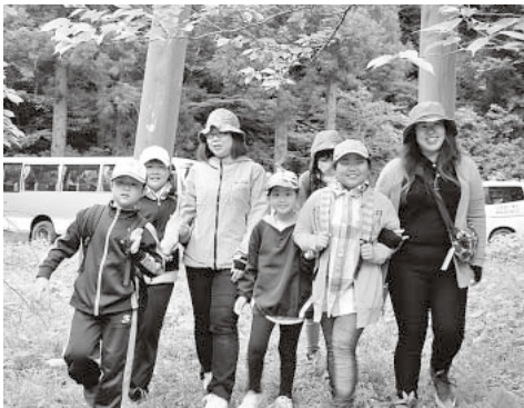
大鳥居前から徒歩で石の塔を目指す

イタコで、老婆が、三途の川が急流すぎて渡れそうにないが、と問うたら、今は川の下を新幹線が走っているから、それに乗れば極楽さ行けるよと諭した」と、軽妙な語り口