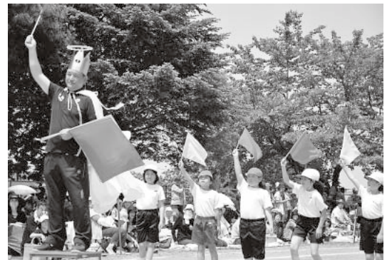
大鰐小学校運動会(平成27年5月24日)

今年は県内外の ホラ吹き11人衆が集結し 宇宙人に、ホラ共和国 青森都構想に、ロボット社会・・・ よくもまあ次から次へと 大ボラが出るもので 顎で膝を叩いて しまいました→