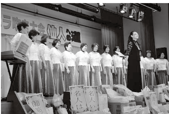
大館市のコーラスグループが会場を魅了