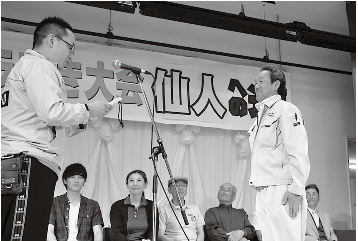
万国ホラ吹き大会(鰐come・平成27年6月6日)