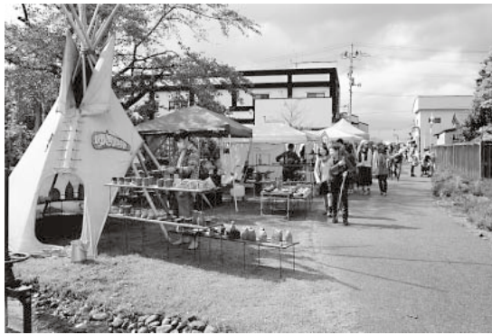
2.1kmの小径に作品がずらり

9時から午後4時 場所 中央アップルモール 板柳町役場(板柳町大字板柳字土井239 3)近く 入場料 無料 問い合わせ先 クラフト小径実行委員会 ☎090 3405 4672