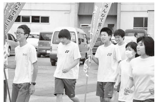
社会を明るくする運動(大鰐中学校・7月13日)

毎月20日は、健康の日です 健康で長生きの一步は 悪しき生活習慣の改善について 自ら自覚して まずは できることから