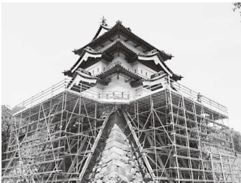
曳屋工事開始を待つ弘前城天守

弘前城本丸石垣修理に伴う天守曳屋(ひきや)を身近に体験できるイベントを開催します。天守を天守台から引き離し、作業台に取り付けたロープを引く体験ができます。 とき 9月21日、27日、午