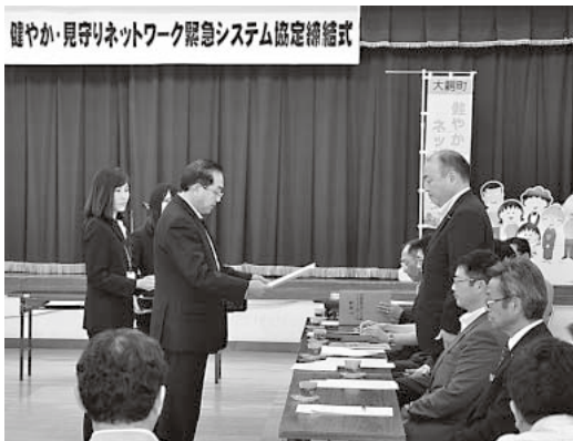
山田町長が各協力機関への協定書を交付

町では、搜索の依頼を受けた情報をFAXを通じて各協力機関へ一斉配信し、それを受けた協力機関では日常業務の中で、その情報を活用しながら、手がかりとなる情報等があれば警察黒石警察署大鰐分庁舎に提供してもらう事としています。