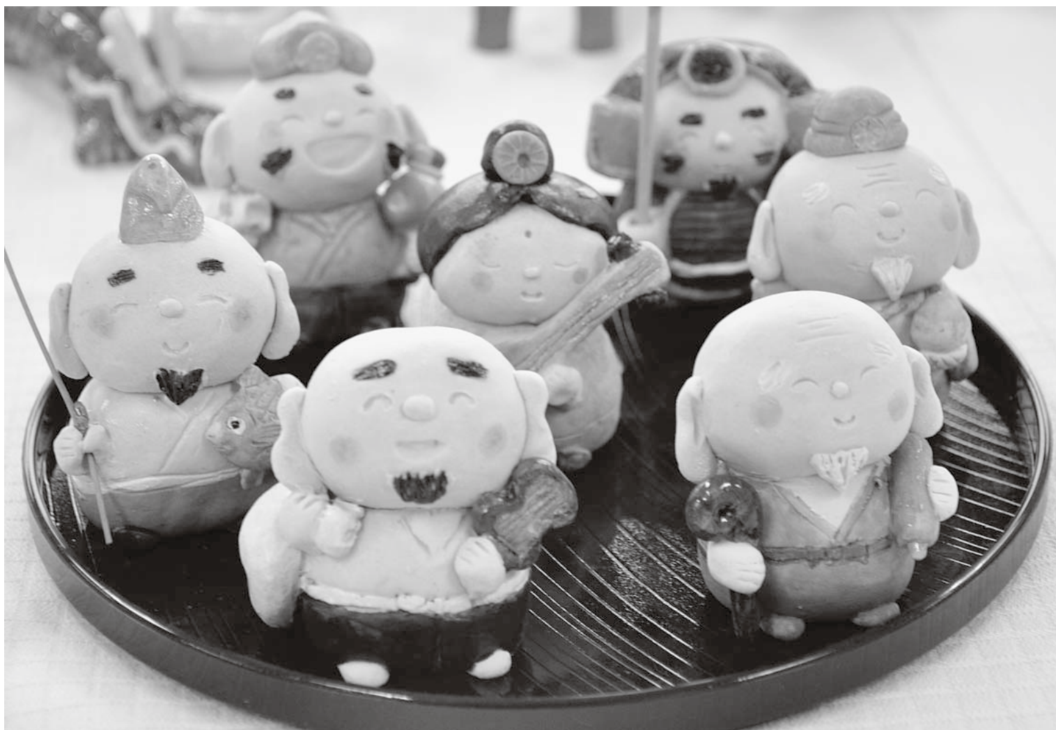
おおわに文化祭(10月31～11月3日・町中央公民館)

大鰐町ホームページアドレス http://www.town.owani.lg.jp