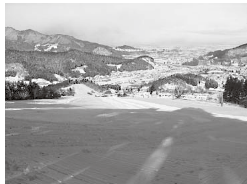
12月19日オープンする「大鰐温泉スキー場」

営業期間(予定)：12月19日(土)～3月13日(日) 大会期間中は、一部コースの