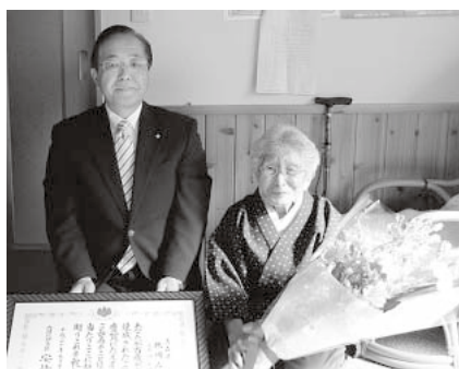
百歳長寿顕彰を受ける北川さん