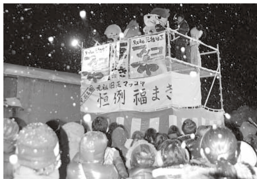
旧正マッコ市恒例の「福まき」

また、市内の商店では、各種商品を割引販売する他、金額に応じてマッコ(景品)のプレゼントなどがあります。お誘い