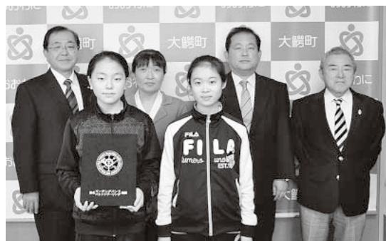
鰐小マーチングバンド東北大会での優秀賞を報告 (11月12日・町長室)

七福神は船に乗って やってくるが さあーと 今年は おぼんに乗って 福を届けましょう