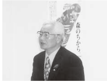
佐々木会長が募金活動協力を呼びかけました。