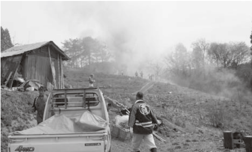
写真は先月、三ツ目内地区で発生した林野火災です。山頂部では用水の確保が難航した。

火事を出さないように次の点に注意しましょう。 入山者は携帯用の吸い殻入れを準備し、タバコの投げ捨ては絶対にしない。 野山でのたき火は後始末を完全にする。 風の強いとき、空気の乾燥しているときは火を使用しない。