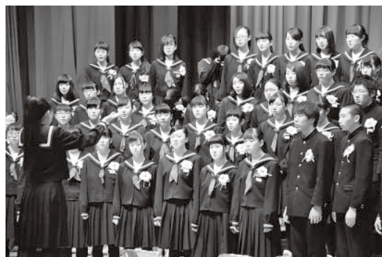
大鰐中学校卒業式( 3月11日 )

入学した日が 昨日のように 思える今日 新たなる決意と 志とを胸に 其々の道を 歩み始める