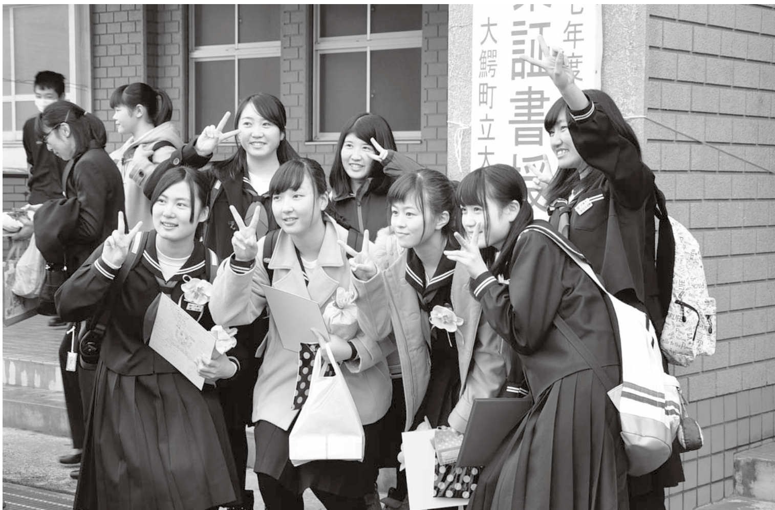
大鰐中学校卒業式( 3月11日 )

大鰐町ホームページアドレス http://www.town.owani.lg.jp