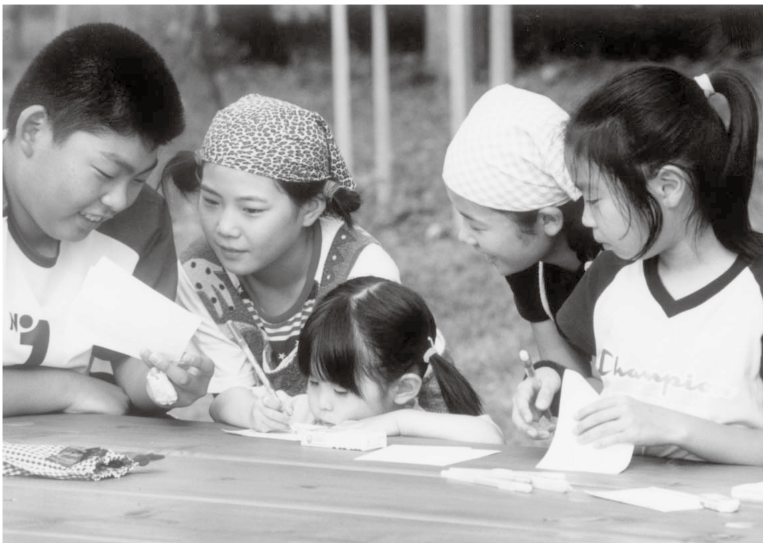
あじらの森キャンプ場

大鰐町ホームページアドレス http://www.town.owani.aomori.jp