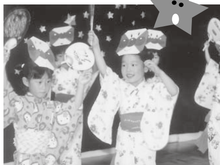
浴衣姿がとっても可愛いアンパンマン音頭です

大鰐保育所では七月五日、七夕まつりに大鰐地区の老人クラブの方々を招いて交流会を開催しました。同所では、ひな祭り時にも交流会を行っており、職員の方々により、彦星と織姫が一年に一度会えるというお話を幻想的な演出で始めると、子供達は水を打ったように静まりかえり聞き入っていました。