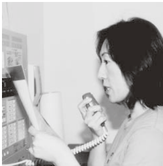
職員の皆さんは、的確な指示で避難者を誘導していました