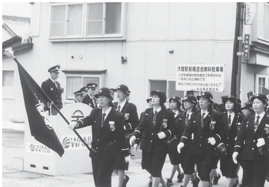
旧役場跡地前で行われる分列行進 (写真は昨年(平成14年)の第17分団の様子です)

機械器具点検、放水訓練を始め、徒歩及び車両分列行進を行い、大鰐町が災害のない安心して暮らせる町づくりのために、今年一年の活動に向けて、決意を新たに士気を高めます。この雄姿の見学をお待ちしています。