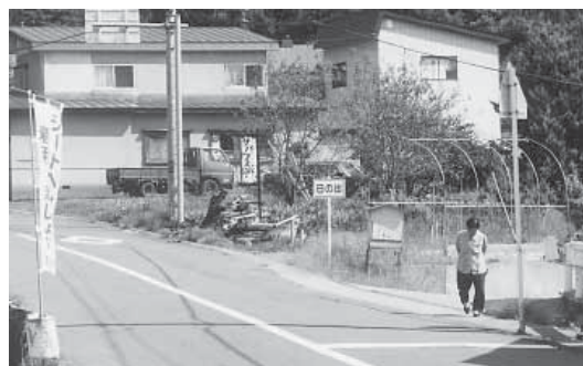
統一したい標識・案内板

答 (町長) 二十二の集落の標識案内板を含め全体的にわかりやすいサイン計画について、担当の企画観光課に検討するよう指示したところです。