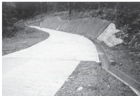
13年度から整備している「民有林道駒木沢線」

ス費用で入所者一人当たり月平均二万四千円、ヘルパー派遣等の在宅介護サービスの場合では利用者一人当たり月平均約五千五百円の負担増になると推測しています。