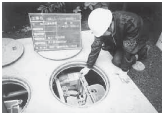
環境衛生のため早期設置が望まれる合併浄化槽

例えば、五人槽で設置費用をおおむね九十万円と仮定した場合、実質町負担額は約二十六万円、設置者の負担額は約九万円です。