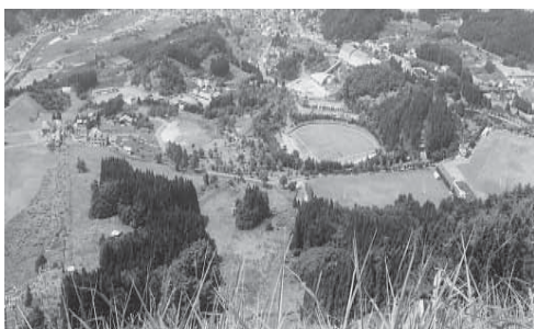
合併後も有効活用したい「あじやら都市公園」

答（町長） 協定書を見ますと、今議員が言われたように町が主導でOSKを経営していく中で、OSKが返済計画を立てて返済する」と、そうなると思っています。何やらわかったようにならないような部分で、いかなる意図のもとにつくられたのかはわかりませんが、少なくとも、町が返済する」という言葉は見当たりません。したがって、今のところは余計な推測をするよりも額面どおりに解釈するべきと思っています。