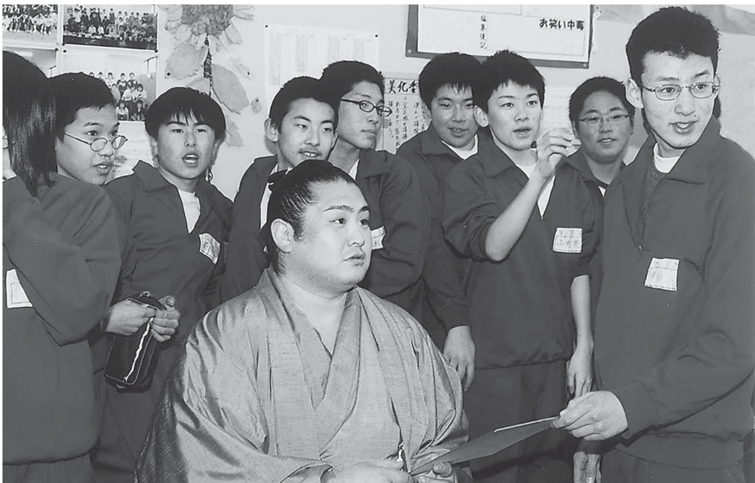
三年四組だったころの自分の席で先輩からのサインに応じる(大鰐中学校)

大鰐町ホームページアドレス http://www.town.owani.aomori.jp