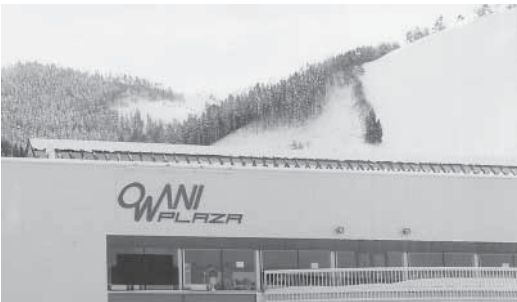
現状では外形標準課税の納税義務が発生する第三セクター

の状況にあり、前例のない就職難々さまざまな要因による町民や農家らの経済事情等、町民だれしも厳しい局面にある状況を認識され、町民とともに、少しはその痛みを分かち合っただけきたい。