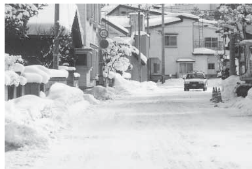
流雪溝として活用したい蔵館地区の側溝

答（町長） 流雪溝の水量の確保については、蔵館地区のみならず、河川に隣接している三ツ目内・虹貝・元長峰・大鱧・森山等々からも河川の表流水を流雪溝に取り入れ、冬期の雪道安全対策に活用したい旨要望