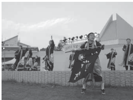
野外ステージで行われる「そうまD Eヨサコイ」

は無料です。皆さんお誘い合 わせのうえお出でください。 日時 7月17日(日)午後1時 から 場所 星と森のロマントピア お問い合わせは 相馬村商 工会 ☎84 3279