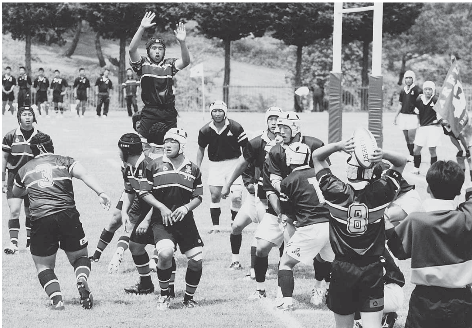
第56回東北高等学校ラグビーフットボール大会(大鰐あじら公園ラグビー場)

大鰐町ホームページアドレス http://www.town.owani.aomori.jp