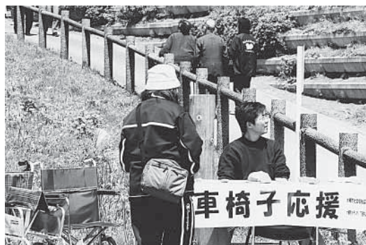
つつじまつり会場では車椅子応援ボランティアが活躍

鬼のような形相でボールを持つ相手に飛びつく 汗が飛び散る 兄弟げんかで 取っ組み合いしたころを ふと思いだす 彼らは全身全霊を傾け ゴールを目指してぶつかり合う ラグビーにはそんな逞しさと勇気 そして潔さがある