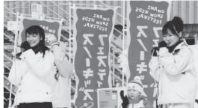
『りんご娘。』のコンサートに子供達は大喜び