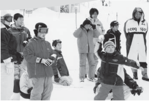
子供達は寒さも忘れてゲームを楽しむ