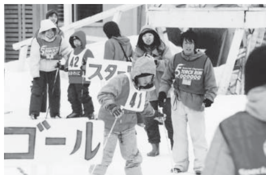
第2回青森県スキー大会2006in大鰐(スペシャルオリンピック日本・青森)

今年開催されたトリノ冬季オリンピックで 大活躍の福田修子選手は 本町初の『町民栄誉賞』が贈られた オオワニ・スノーキッズフェスティバルでは 多忙なスケジュールの中 こども達とともに過ごして 何ものにも替えがたい思い出を こども達にプレゼント 輝かしいゴールに拍手