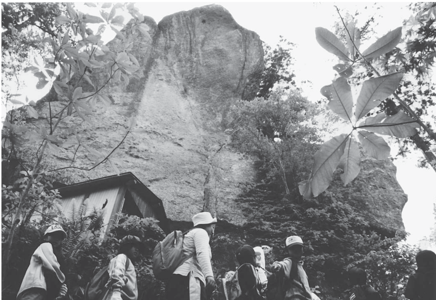
石の塔(大鰐・碓ヶ関温泉郷県立自然公園)