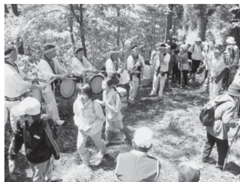
参加した小学生の多くは、石の塔を初めて見るとあってその大きさに驚く(万国ホラ吹き大会・石の塔登山)