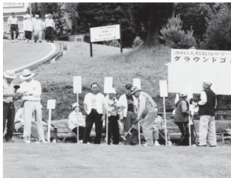
全国大会が来年開催されるとあって選手も気合が入ります