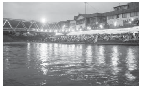
大鰐の夏がやってきた(大鰐温泉サマーフェスティバル2006)

今年も県内のラグビーを愛する人たちが あじゃらラグビーグラウンドに集合 たくさんの思い出を積み重ね 語り継がれる大会として これからも末永く開催されますように