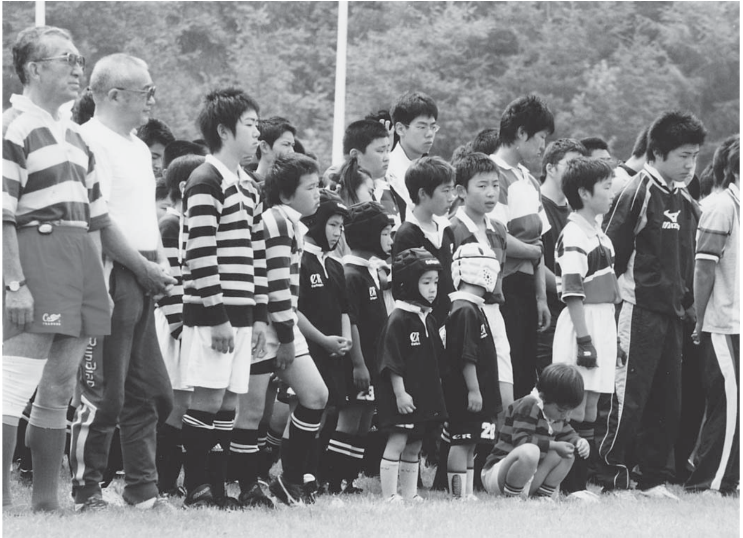
第5回青森県ラグビーカーニバル(あじゃら公園ラグビー場)

大鰐町ホームページアドレス http://www.town.owani.aomori.jp