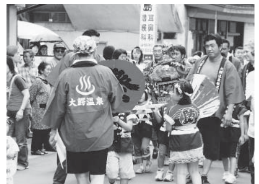
こども神輿が復活(2006大鰐温泉サマーフェスティバル)