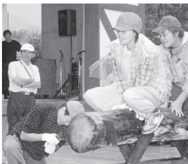
自由参加ですのでぜひ！

とき 9月17日(日) ところ アクアグリーンビ レッジANMON お問い合わせは 西目屋村 商工会 ☎(85)2828