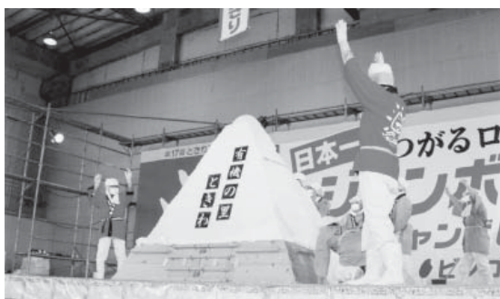
見事に完成したジャンボおにぎり

とき 11月2日(木)・3日(金) ところ メイン会場＝藤崎 町農業者トレーニングセンター お問い合わせは ときわい いきいきまつり企画実行委員会 (藤崎町企画課内) ☎(75)31 11