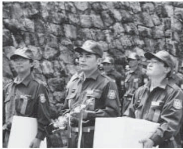
第4分団(唐牛)が優勝