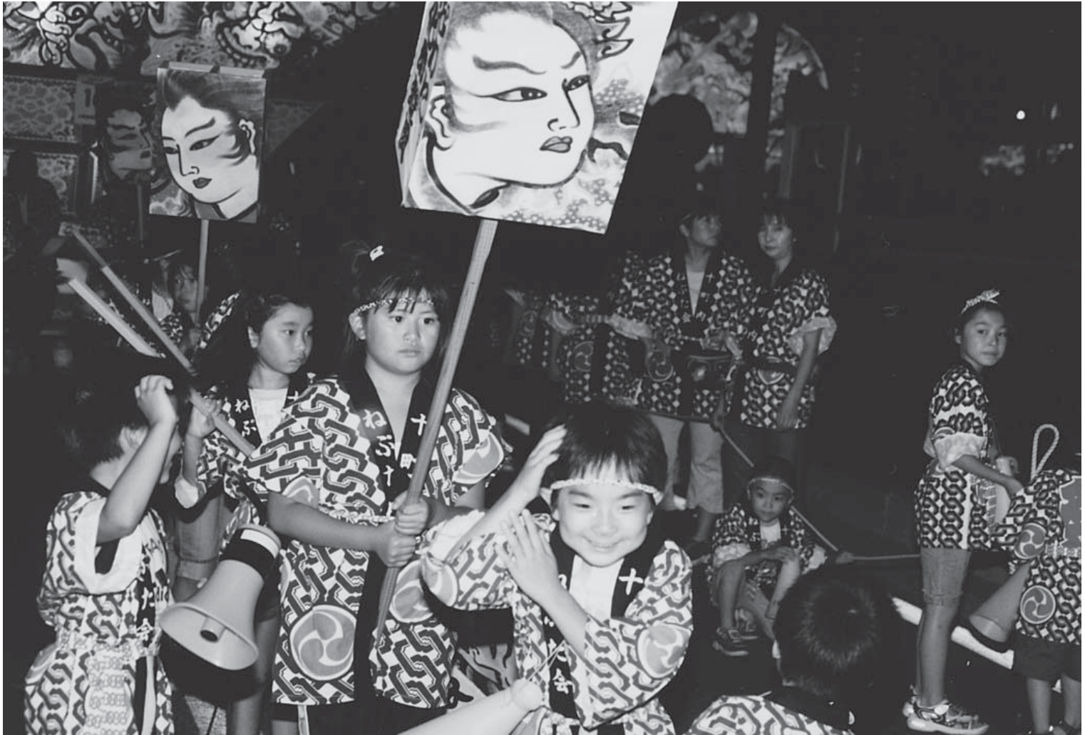
大鰐温泉ねぶたま祭り(2006大鰐温泉サマーフェスティバル)