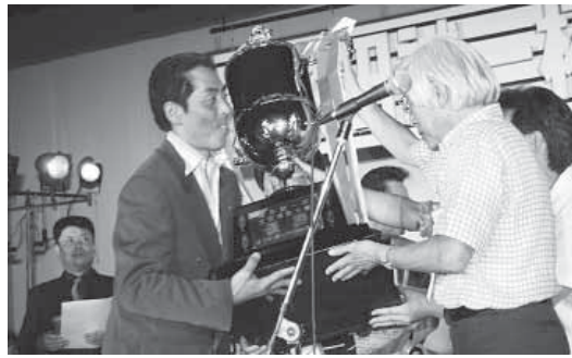
全国からのど自慢が集まります

ストとして登場し、会場を盛り上げますので、ご家族そろってお越しください。 とき 8月16日(木) ところ 平川市文化センター文化ホール 入場料 1,500円 問い合わせ先 商工観光課 観光係 ☎44 1111