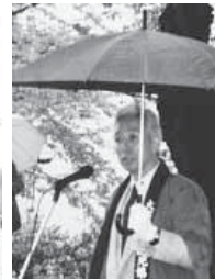
開会式は激しい雨の中、行なわれました

観光協会事務局によれば、まつり期間中の来園者は2万2千人を数えた。週末が雨天続きで、期間中は花がちょうど良かっただけに非常に残念でした」と、語っていました。