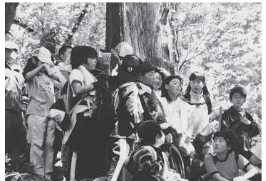
万国ホラ吹き大会・石の塔へ行こう(大鰐小学校四年生・石の塔)

春のスタートは早かったのに 青空の下でとの願いも届かず 雨天に泣かされる運動会 「今日、小も運動会だねなー」とは よく言われるが 見事なまでの的中率です 来年はお日様も ご招待したら・・・