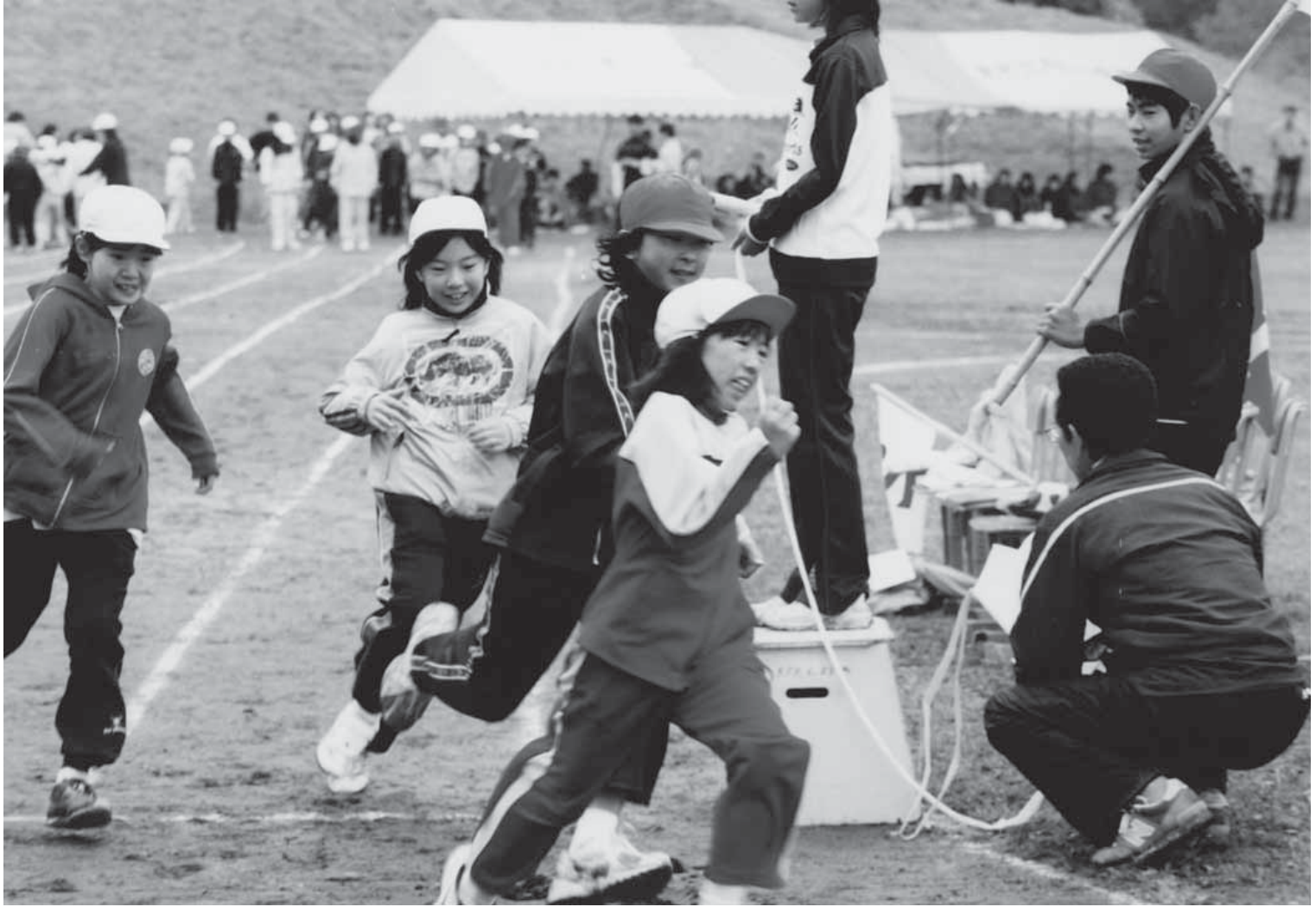
町内の小学校、運動会風景(長小グラウンド)

大鰐町ホームページアドレス http://www.town.owani.aomori.jp