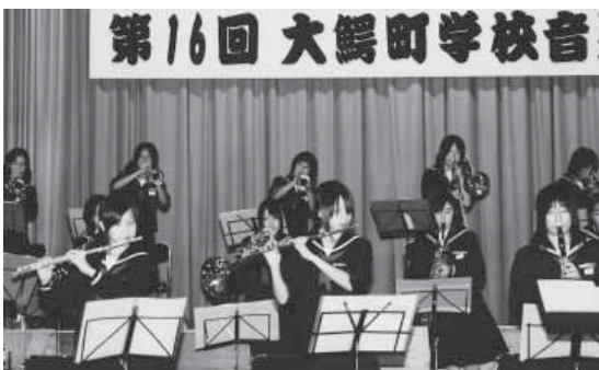
大鰐中学校吹奏楽部