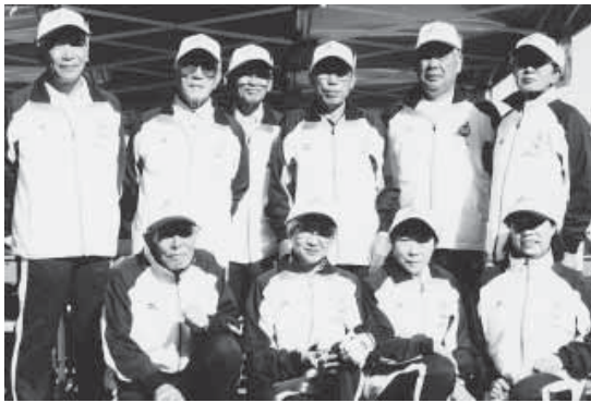
青森Fチームとして参加した当町選手の皆さん