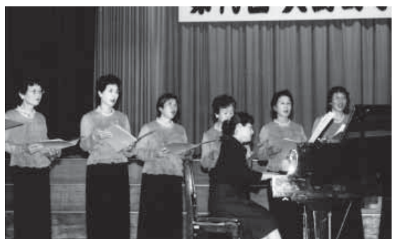
大鰐ラブリーコーラス