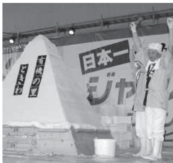
ジャンボおにぎり

問い合わせ先 藤崎町秋まつり実行委員会事務局(藤崎町企画課内 ☎75 3111)