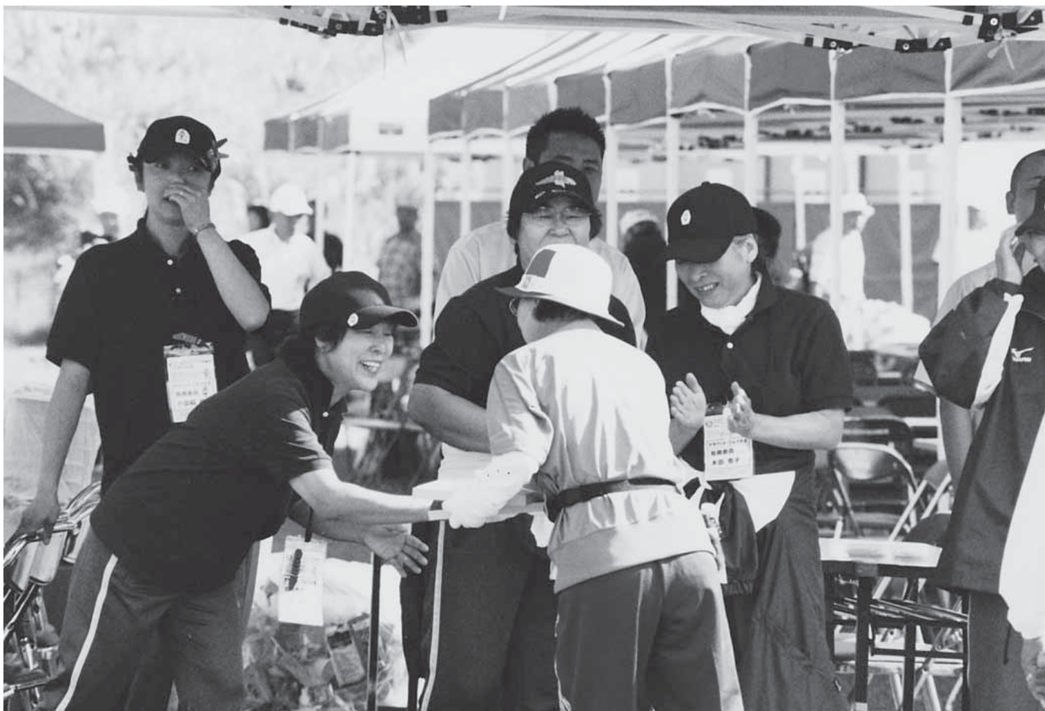
第20回全国スポーツ・レクリエーション祭(あじやら公園)