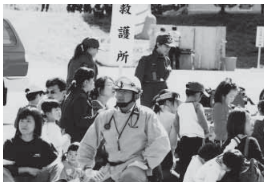
平成19年度町総合防災訓練(雨池スキーコミュニティセンター)

全国大会は手馴れたもの!? 町民の皆さんによる もてなしは 思い出の1ページとして 選手達のこころに刻まれることでしょう 「また、お会いできる日まで」 別れを惜しむ光景が いつまでも続いた