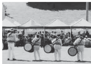
登山離子などを披露、会場から大きな拍手が送られる