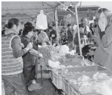
秋の味覚が堪能できます