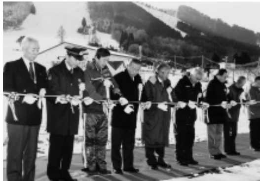
関係者によるテープカット

大鰐温泉スキー場が12月22日、シーズンオープンとなり、スキーセンタープラザでオープンングセレモニーが行なわ