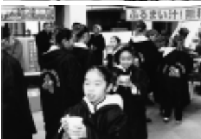
温かいもやし汁が振舞われた