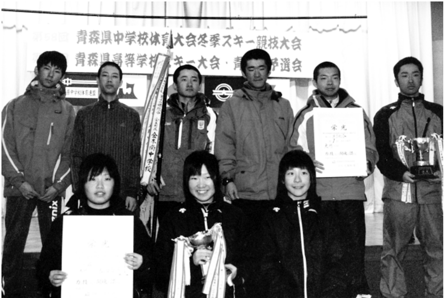
第58回青森県中学校体育大会冬季スキー競技大会 学校対抗、男子優勝・女子2位の鰐中スキー部