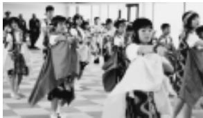
蔵小のよさこいソーラン