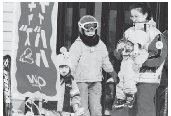
オオワニスノーキッズフェスティバル(平成20年3月1日)

雪舞う卒業の日 学びの足跡が ここにある 別れの数だけ 夢があり 出会いがある 時には交差したり 分岐したり 道は続く