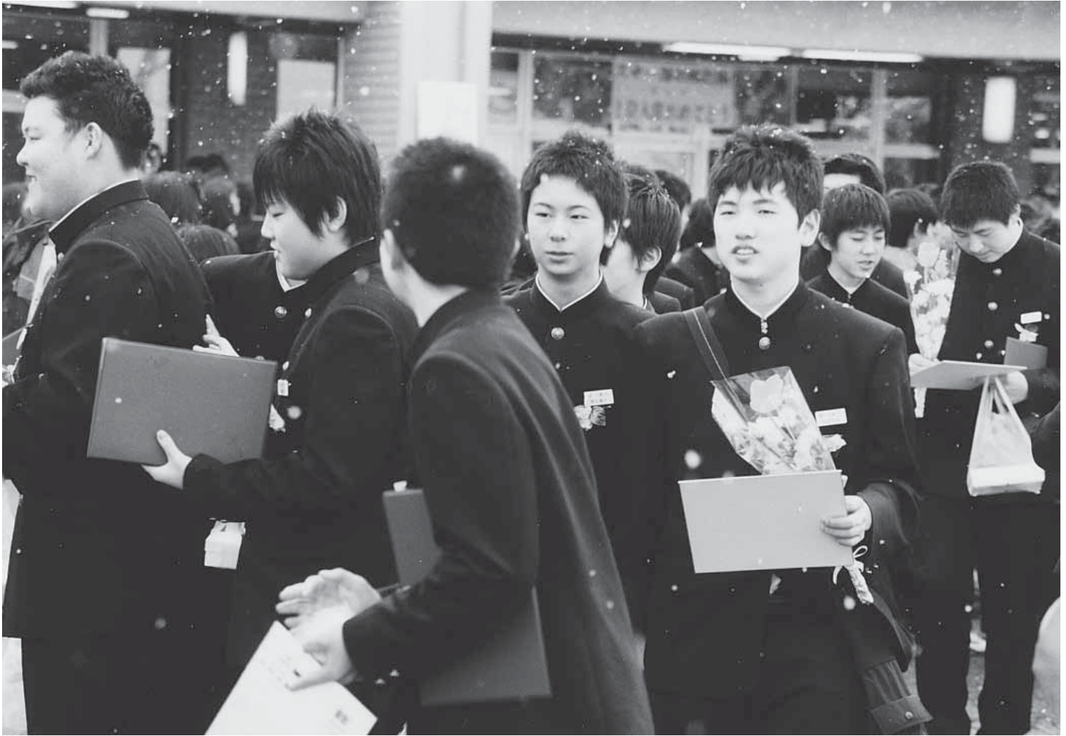
大鰐中学校卒業式(平成20年3月5日)

大鰐町ホームページアドレス http://www.town.owani.aomori.jp