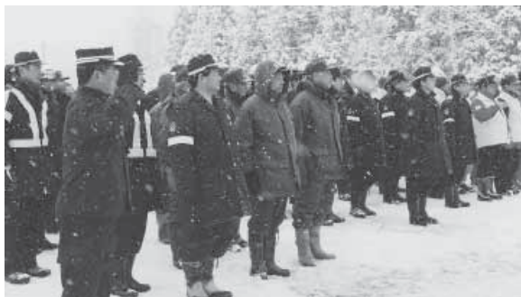
荒天の中、訓練は行なわれた

平野署長は、身勝手なコース外での滑走は危険です。安全には十分注意して楽しんで欲しい」と、語っていました。