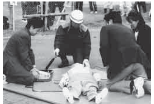
町総合防災訓練 / AED救命訓練(大鰐中学校)

災害の時は 情報が時間とともに 種々にわたって錯綜する 守るべきは 今すべきことは 自分たちができることは その判断力と行動力が 問われる