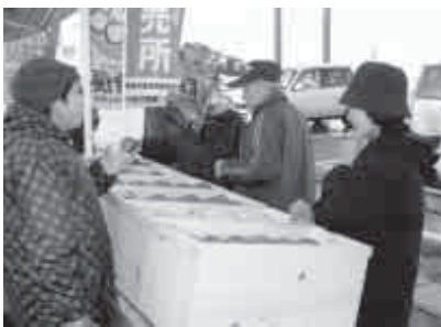
地元産品盛りだくさん!

ところ 藤崎町役場前駐車場、藤崎町文化センター(どちらも藤崎町西豊田1丁目) 問い合わせ先 藤崎町秋まつり実行委員会 藤崎町企画課内 ☎75 3111