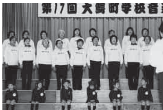
童謡を歌う会とおおわに文化幼稚園