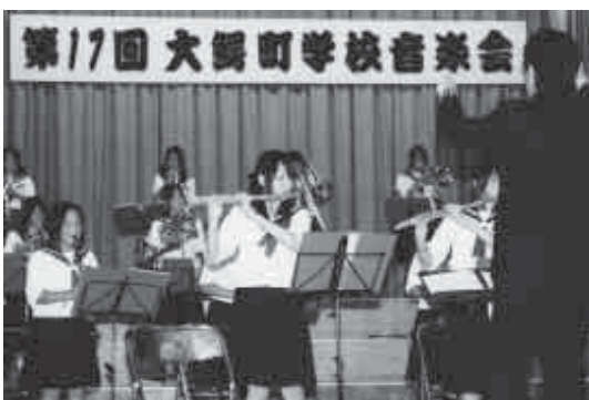
大鰐中学校吹奏楽部