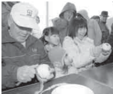
白熱するりんご皮むき大会

当日は駐車場が込み合いますので、バスの利用や家用車に乗り合わせるなどしてご来園ください。 問い合わせ先 弘前市りんご農産課 ☎82 1636