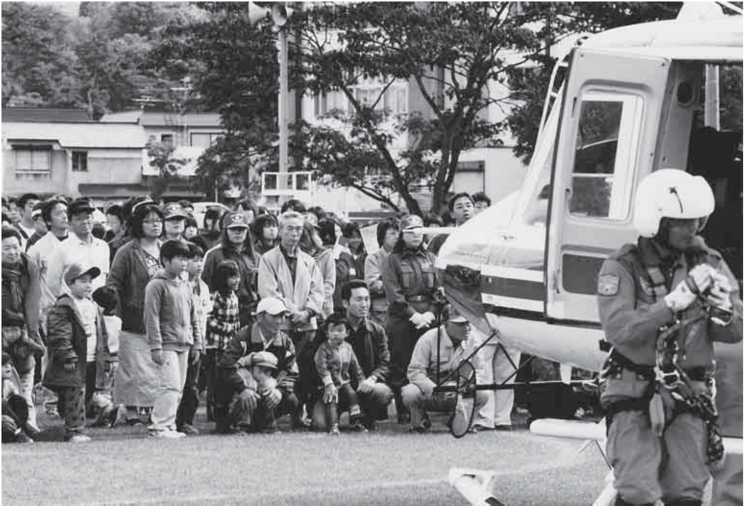
町総合防災訓練(大鰐中学校)