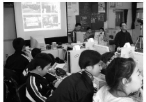
「全国多地点方言交流プロジェクト2008」 (大鰐小・平成21年2月23日)

蛍の光 窓の雪・・・ と歌われたが 今や 携帯電話の光 パソコンの窓 といったところでしょうか