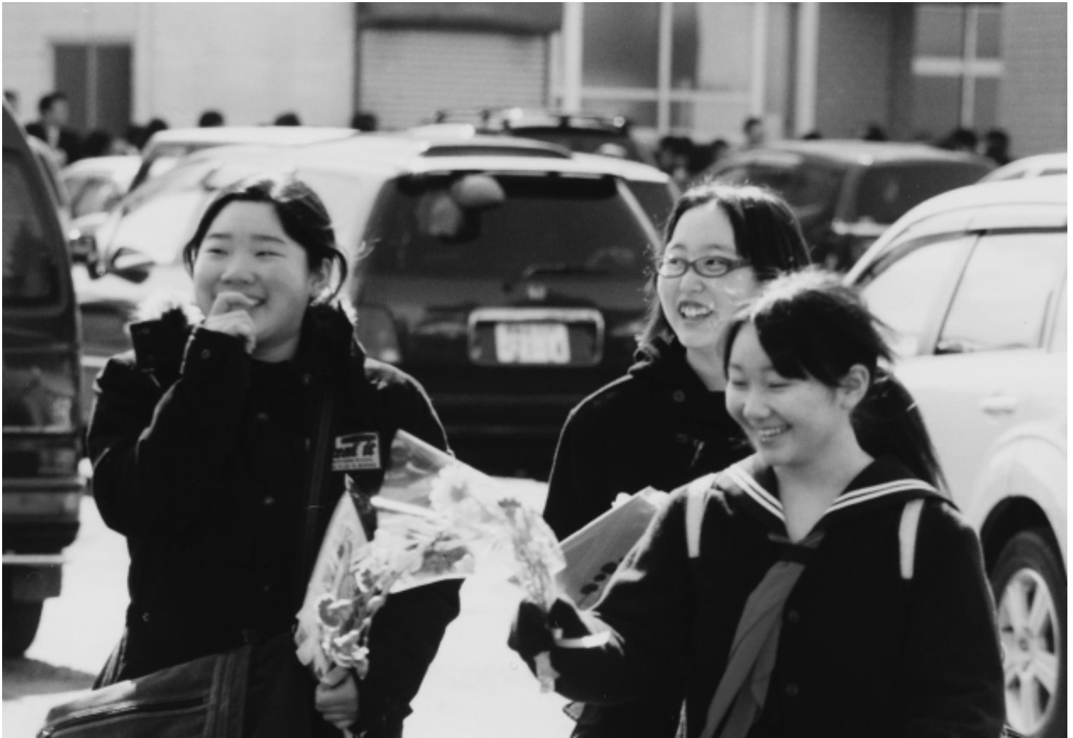
大鰐中学校卒業式(平成21年3月5日)

大鰐町ホームページアドレス http://www.town.owani.aomori.jp