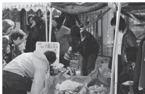
鰐小フリーマーケット(10月11日・鰐come)

全国大会へ3年連続、7度目の 出場を決める 今年も 全国の空に向け 健やかで キラキラ輝ける 鰐小マーチを響かせる