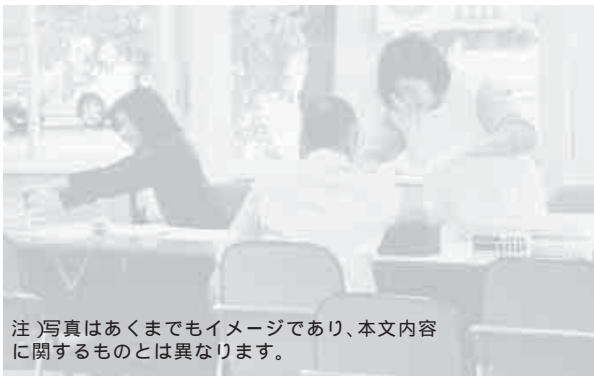
注)写真はあくまでもイメージであり、本文内容に関するものとは異なります。

当町の移動手段は自家用車を中心で、その利便性の高さを否定することはできないが、生活のすべてを自動車に依存した地域社会もまた、望ましいとは言えない。公共交通を再構築するためには、現状や課題をさらに綿密に把握し、他地域の経験も参考にしながら、地域が一体となって取り組んでいく仕組みを作ることが必要である。これまでも、路線バスの廃止・減便をめぐって協議が持たれたことはあるが、鉄道やタクシーを含めた交通事業者と一緒に協議していく必要がある。今後は、町内の合意形成をはかるとともに、町民の移動ニーズや生活実態の詳細な把握、社会実験の積み重ねなどを通じて判断していかねばならない、と提言されています。