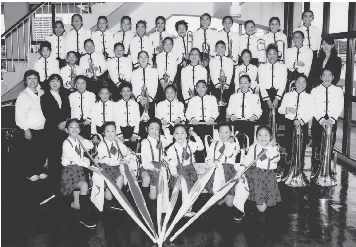
大鰐小学校マーチングバンド部、第32回マーチングバンド・パトントワーリング青森県大会(八戸市体育館)