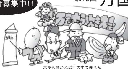
ホラも吹かねば世の中つまらん