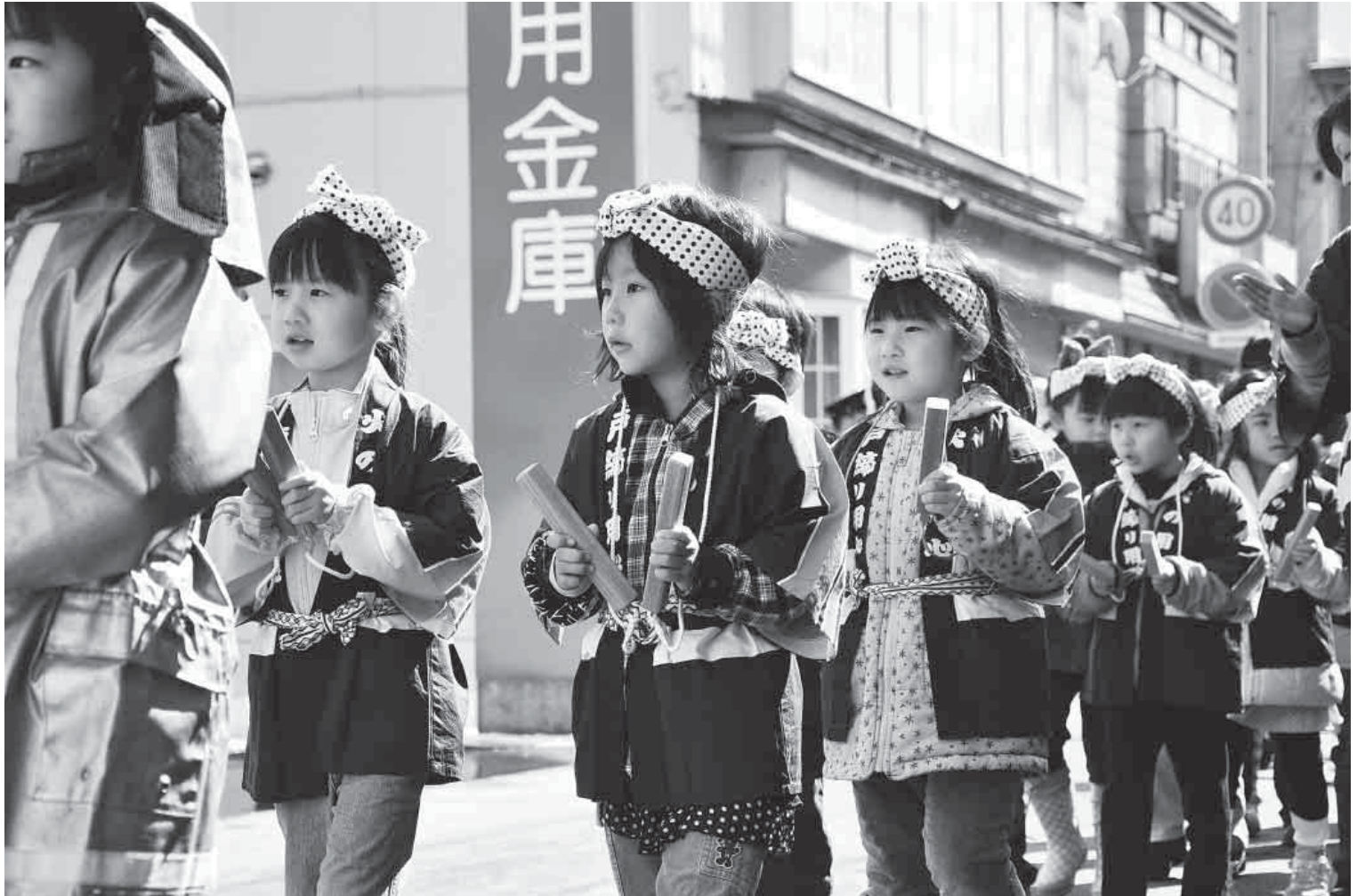
大鰐町消防出初式・大鰐保育園幼年消防クラブ(平成22年3月28日)