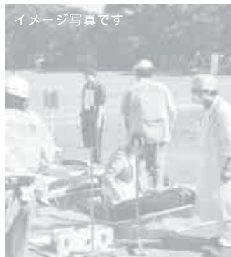
イメージ写真です