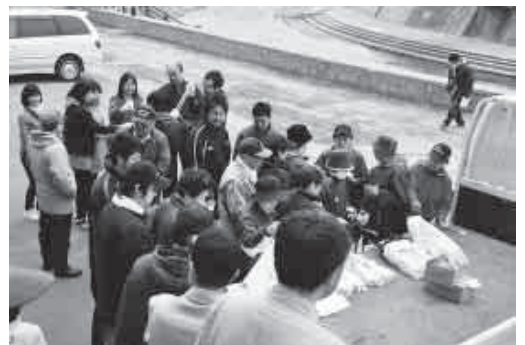
春のクリーン大作戦(4月17日・中央公民館前)

初めて聞く校歌に 視線も右、左 耳になじんで 口ずさみ 声高らかに 歌える日は すぐにやってくる