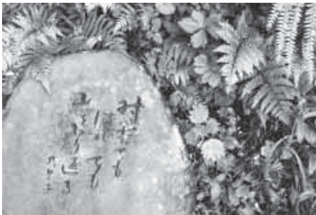
温泉街を眼下に見下ろしながら、小高い丘を縫うように遊歩道は続きます