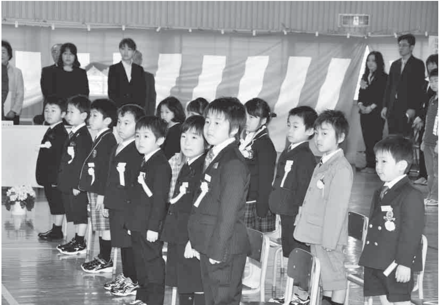
蔵館小学校入学式(4月7日)