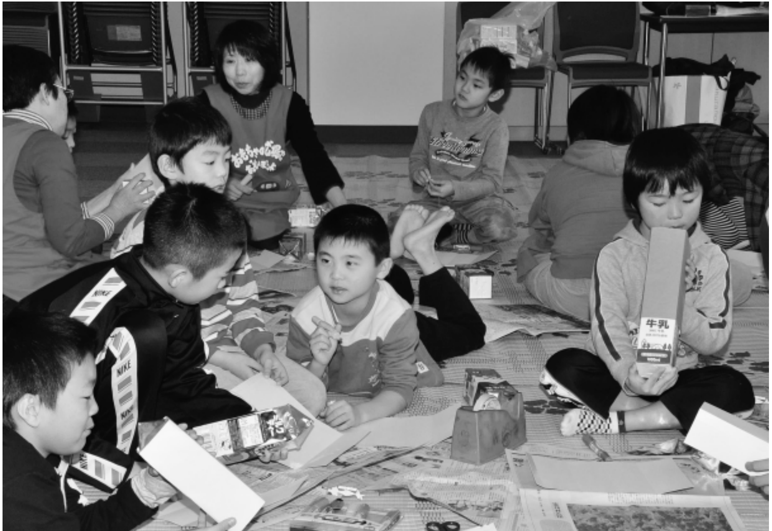
第2回おもちゃの広場で遊ぼうよ(1月6日・鰐come)