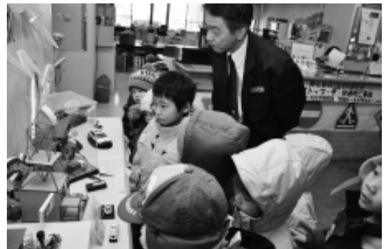
「110番の日」の展示(1月12日・黒石警察署大鰐分庁舎)

おもちゃは 手づくりして遊んだ 欲しくて欲しくて やっと買ってもらえた おもちゃは何よりの宝物 それでも ふと気が付けば どこへやら