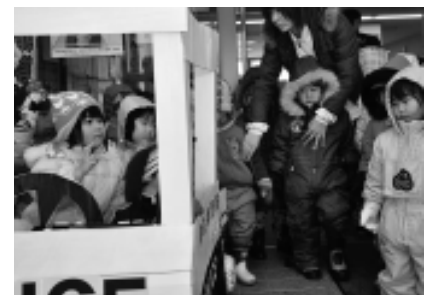
ダンボールのパトカーに乗ってごきげん

また、玄関口には訪問記念の写真撮影スポット用にと、パトカー(ダンボール作品)も設置しました。