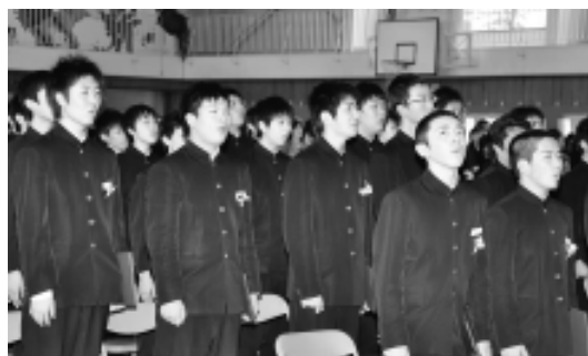
大鰐中学校卒業式(平成23年3月9日)

3月11日午後2時46分、国内観測史上最大の 激震が宮城県沖で発生 宮城、岩手、福島、茨城 青森などの太平洋側沿岸部地域を 津波が襲った 死者は本県3人を含め 万人単位に及ぶだろうとも報じられた