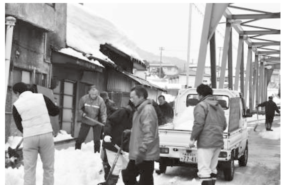
通学路除雪ボランティア(大鰐6町内・3月2日)

昨年3月11日、東日本大震災が 日本中を震撼させた 想定されることとして これを記録し伝える 明日の為に