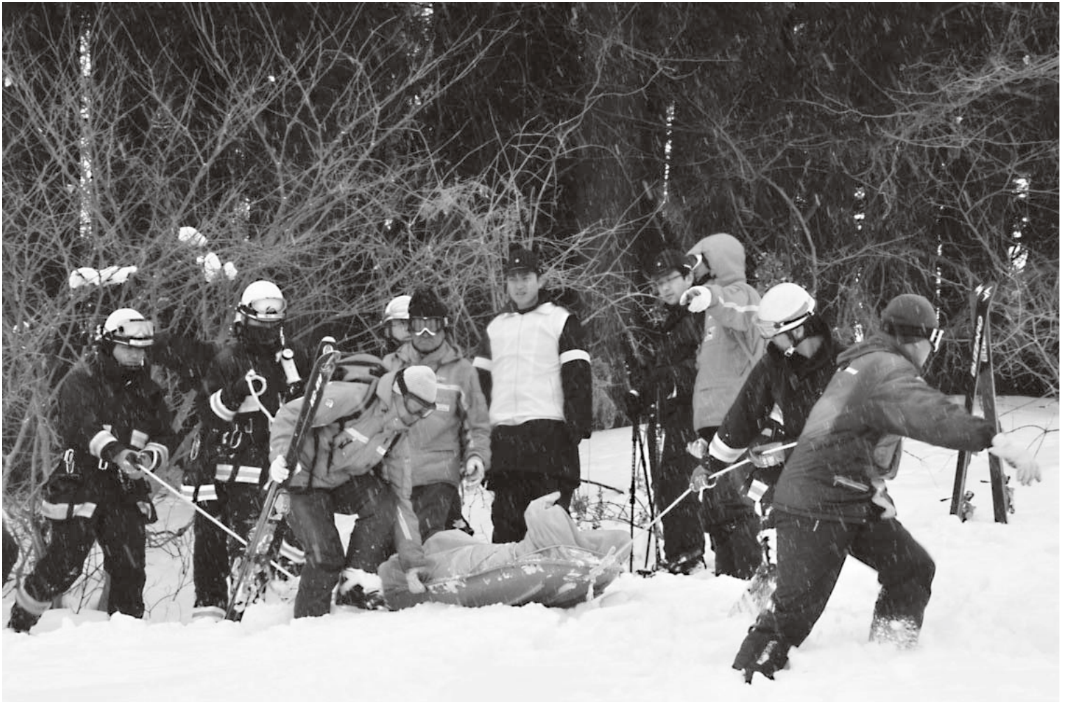
冬山遭難者救助訓練(大鰐温泉スキー場・3月5日)

大鰐町ホームページアドレス http://www.town.owani.lg.jp