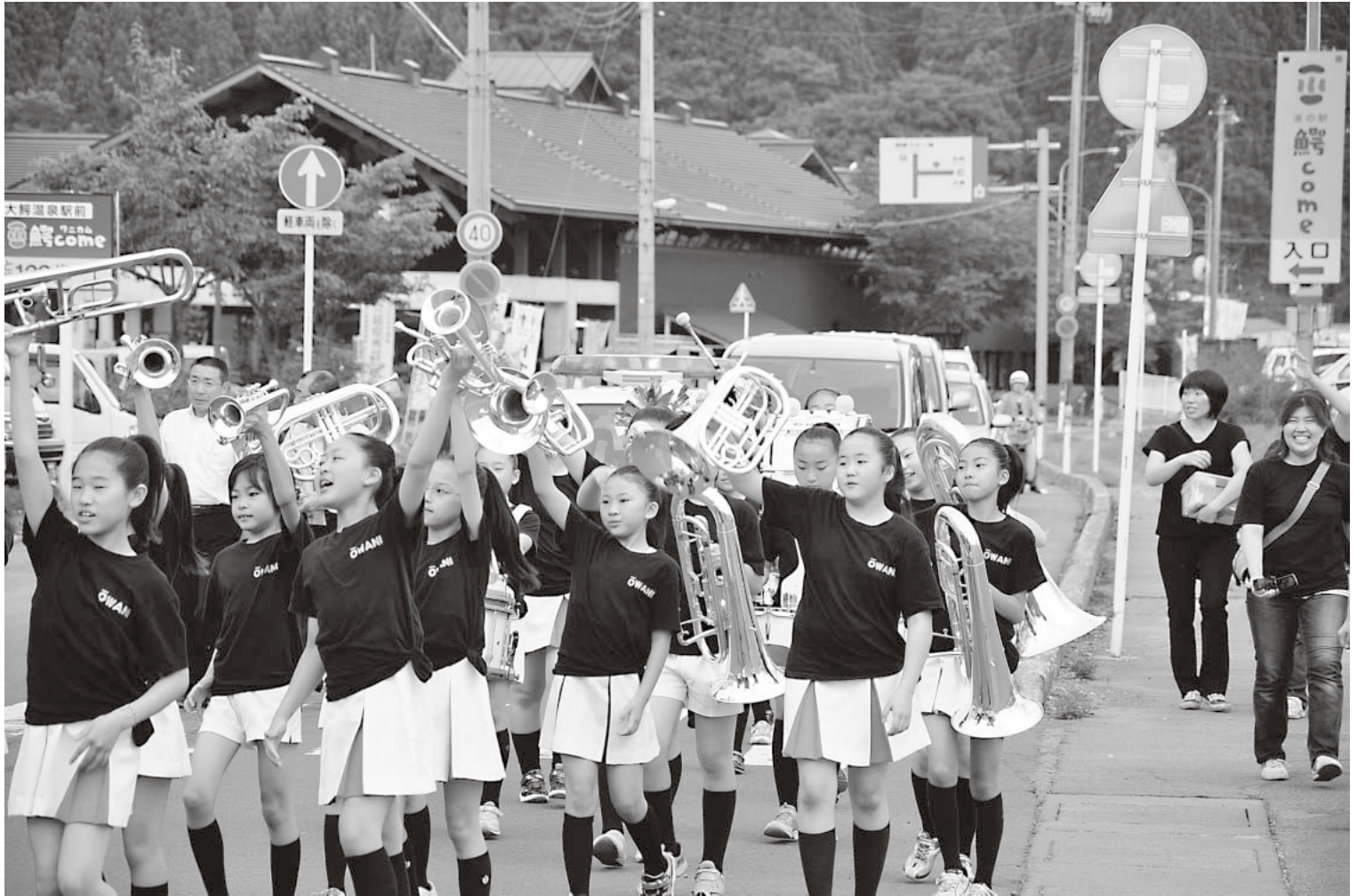
第62回「社会を明るくする運動」町民総決起大会 パレード(7月9日)