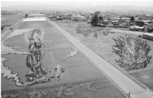
第1アート「悲母観音と不動明王」

団体割引はありません 問い合わせは 田舎館村産業課 商工観光係 ☎58 2111 内線143