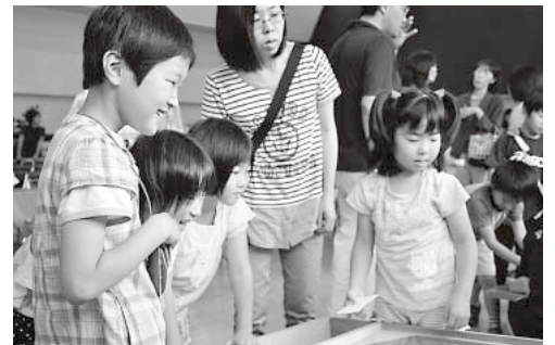
児童館まつり(町総合福祉センター・7月8日)

いつも元気で明るく 爽やかな演奏を 皆に届けてください いつまでも 明るく住み良い町で ありますように