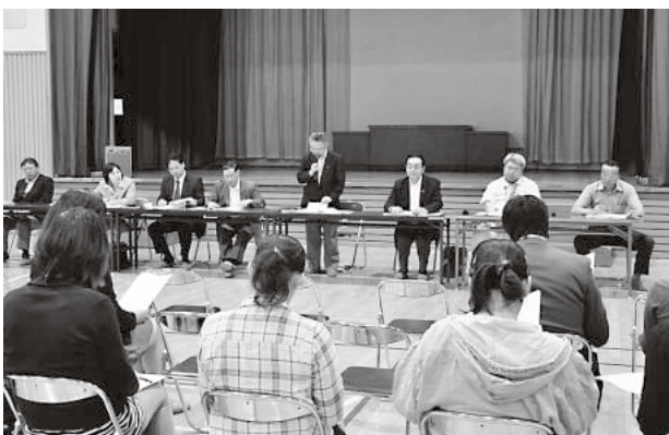
蔵館小学校での懇談会

合は6年を目途に、条件が整いしだい進め段階的な統合も、など8項目が示された。町教育委員会としては答申を尊重し、その推進のための具体的な統合計画を策定することとしている。今後も、この懇談会を開催して皆さんのご意見、要望をお聞きしたい」と説明。 参加者からは、この問題の諮問となつたきつかけは「児童の徒歩通学距離の限度はどの程度を目安としているのか」「段階的、条件が整えば……との内容はどのようなものか」「合併後の学校施設を児童の放課後活動の場として活用を」などの質問や要望が出されていました。