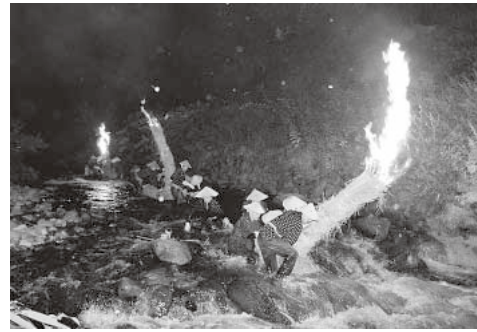
激流の中で舟を走らせる舟子たち

時 場所：中野川(大川原橋上流) 問い合わせは 商工観光課 観光物産係 ☎52 2111 内線407