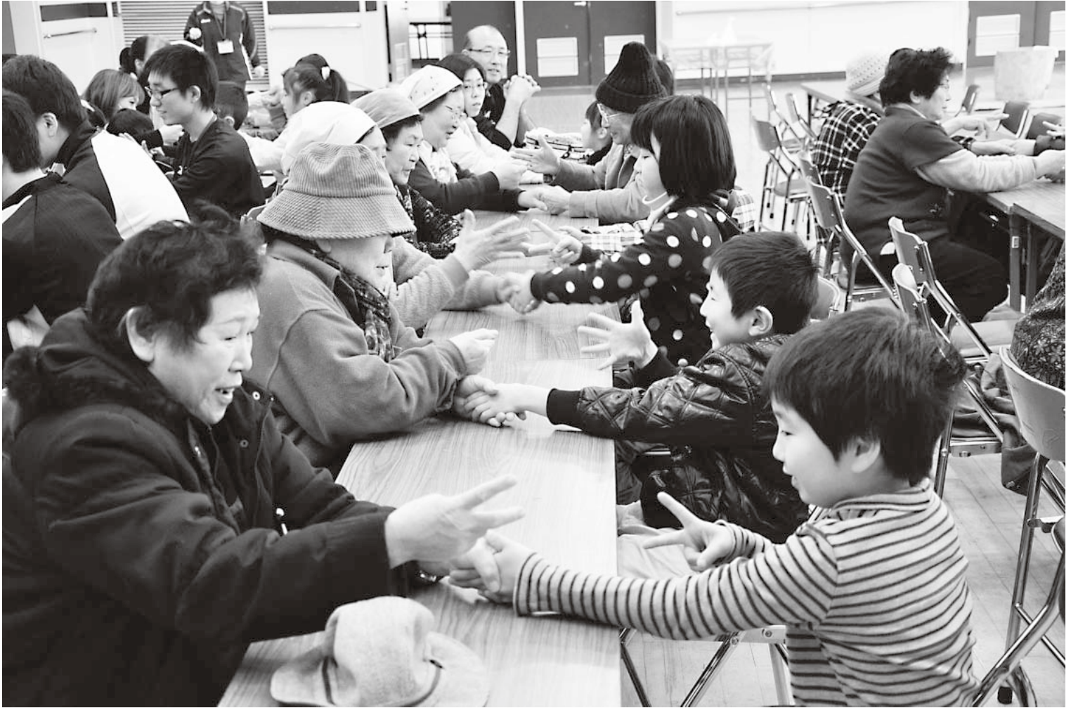
三世代交流もちつき会(町総合福祉センター・1月20日)