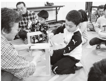
木工教室「本棚づくり」