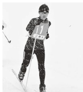
女子リレー優勝の大鰐小Aチーム