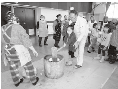
三世代交流もちつき会