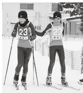
男子リレー2位の蔵館小Aチーム