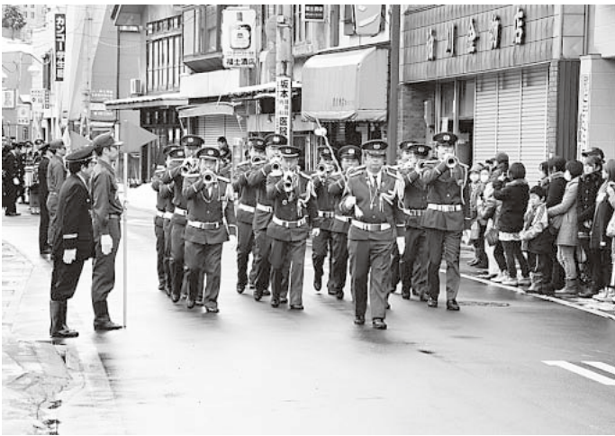
町民の皆様、ぜひ、この雄姿を見学にお越しください。お待ちしております。

出初式はこの消防団員の士気の高揚を図り、人員服装点検、機械器具点検、放水訓練をはじめ、徒歩及び車両分列行進など、訓練の成果を披露し、町民に対する防火・防災意識の啓発を行い、今年一年、大鰐町が災害のない安全で安心して暮らせるまちづくりを推進することを目的としています。