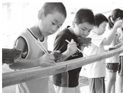
チャレンジクラブ「流しそうめん」