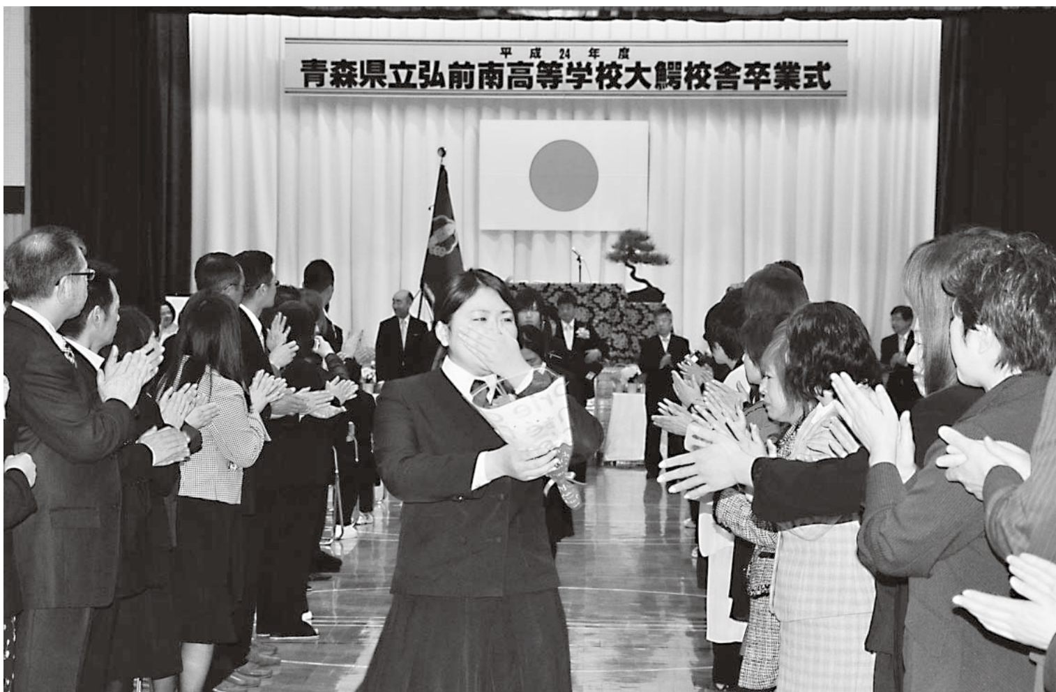
弘前南高等学校大鰐校舎卒業式( 3月2日 )