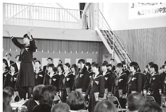
大鰐中学校卒業式( 3月8日 )

弘前南高等学校大鰐校舎の 最後となる卒業式が3月2日に 行なわれ 卒業生33名が 三年間の思い出と 感謝を胸に 学び舎を後にした