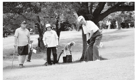
グラウンド・ゴルフ交歓大会(7月19日・大鰐温泉サマーフェスティバル)