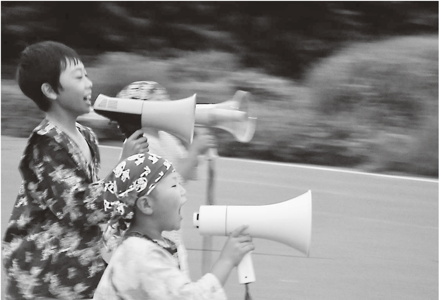
大鰐温泉ねぶたまつり(2013大鰐温泉サマーフェスティバル)

大鰐町ホームページアドレス http://www.town.owani.lg.jp