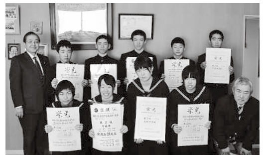
大鰐中学校スキー部が県、東北、全国大会での入賞を報告(2月17日・町役場町長室)

雪国に生まれて 雪なんかを負けてられません みんなで楽しんで たくましく 育ってね