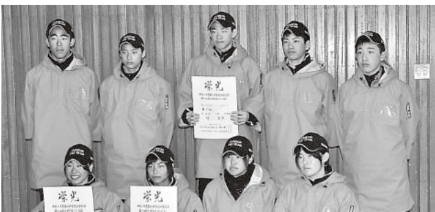
男・女のリレー種目は共に2位

今大会での大鰐中学校スキー部の成績は、男子が総合3位・女子が総合2位、クロスカントリールー競技のリレー種目がともに2位となりました。