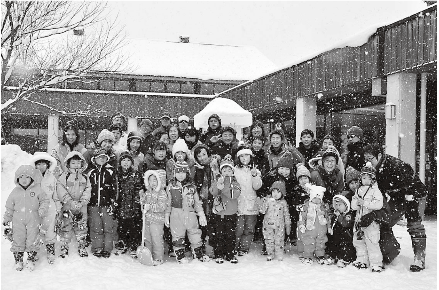
雪の子わんぱく大会(1月12日・鰐come)

大鰐町ホームページアドレス http://www.town.owani.lg.jp