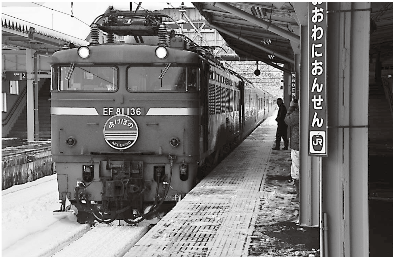
寝台特急「あけぼの」(大鰐温泉駅・3月14日)

大鰐町ホームページアドレス http://www.town.owani.lg.jp