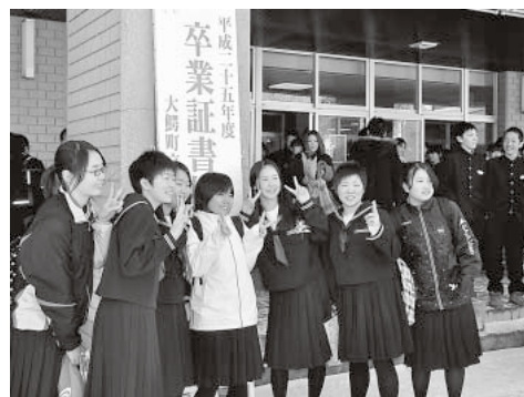
大鰐中学校卒業式(大鰐中学校・3月10日)

上野を乗せ、津軽を乗せ 夢も乗せ、挫折も乗せて 昭和、平成へと走り抜けた 寝台特急「あけぼの」 多くの人々の思い出を 静かに眠らせて 去り行く