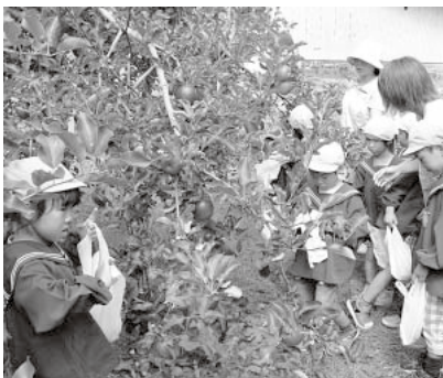
もぎ取り体験に大喜びの蔵館保育園園児