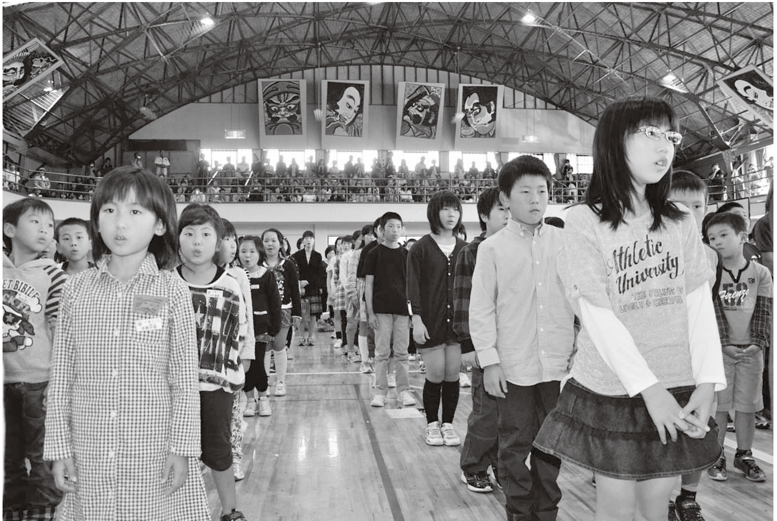
第23回学校音楽会を開催( 9月27日・大鰐小学校体育館 )