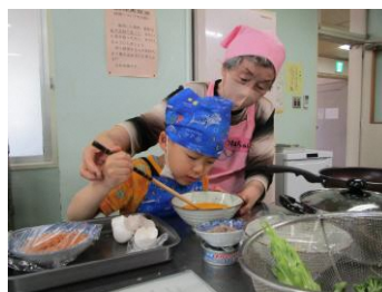
ふれあいクッキング