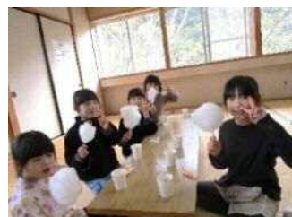
みんなで食べる綿あめは最高!