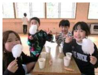
窓辺に迫る桜にうっとり